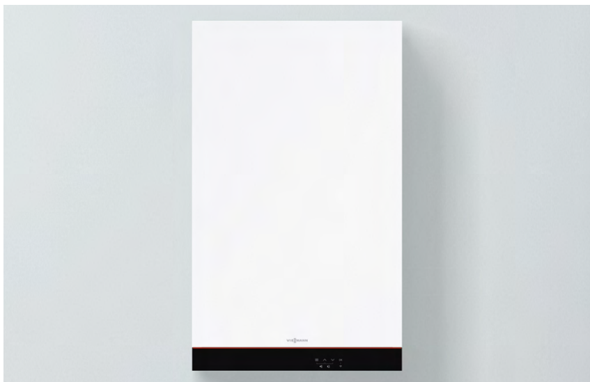
Vitodens 100-E : nuovo design e colore Vitopearlwhite

Profonda soli 249 mm, Vitodens 100-E è ideale nelle sostituzioni di vecchie caldaie installate in qualsiasi contesto abitativo.